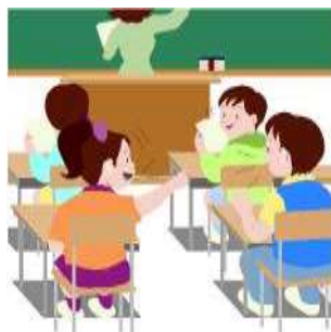
ГРАФИК ЗАНЯТОСТИ КАБИНЕТА № 110а