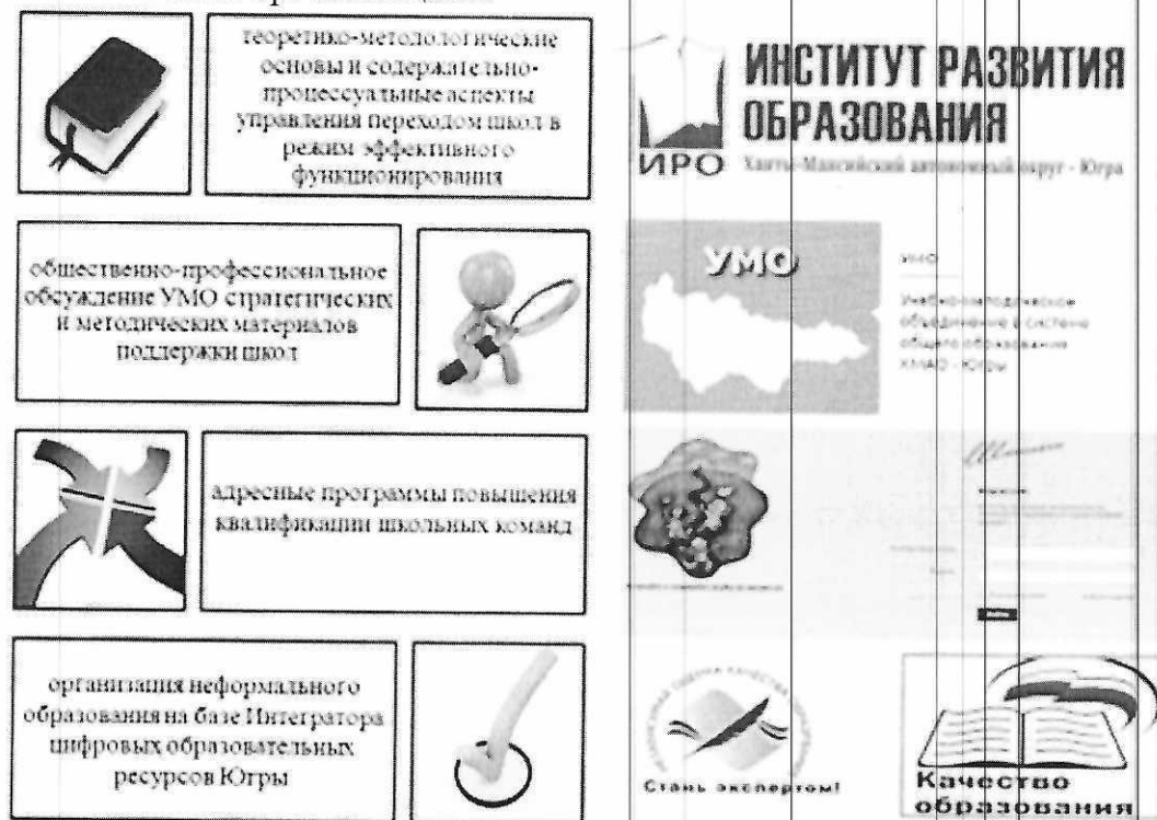
Рисунок 2. Модель кадровой поддержки образовательных организаций с низкими образовательными результатами

Модель кадровой поддержки образовательных организаций с низкими образовательными результатами (рисунок 2) – это система организационных условий, мероприятий, взаимодействия участников реализации модели адресной методической помощи образовательных организаций с низкими образовательными результатами, мониторинга, обеспечивающих эффективное внедрение модели учительского роста в образовательных организациях.